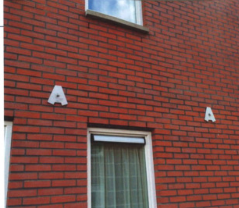
Eindresultaat van een van de testwoningen, te herkennen aan de A-vormige ankerplaten.

De wens was om een zo klein mogelijk gat in de gevel te maken, waar wel doorheen te werken valt, maar dat nadien nog goed af te dekken is met een ankerplaat. 'Zo kwamen we uit op een diameter van 11 cm. Daar past net de hand van een bouwvakker met handschoen doorheen', zegt Olij. Vanwege die beperkte diameter kwamen Olij en collega's op het idee van een opblaasbare ballon: in lege toestand is die