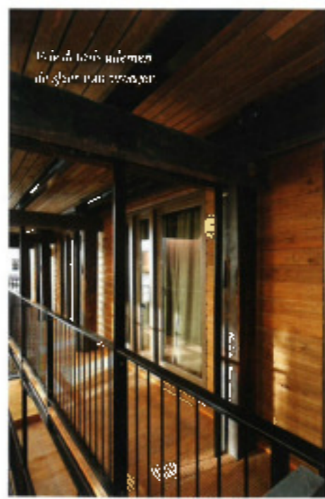
Elke drie vloeren in glas met houten vloeren.