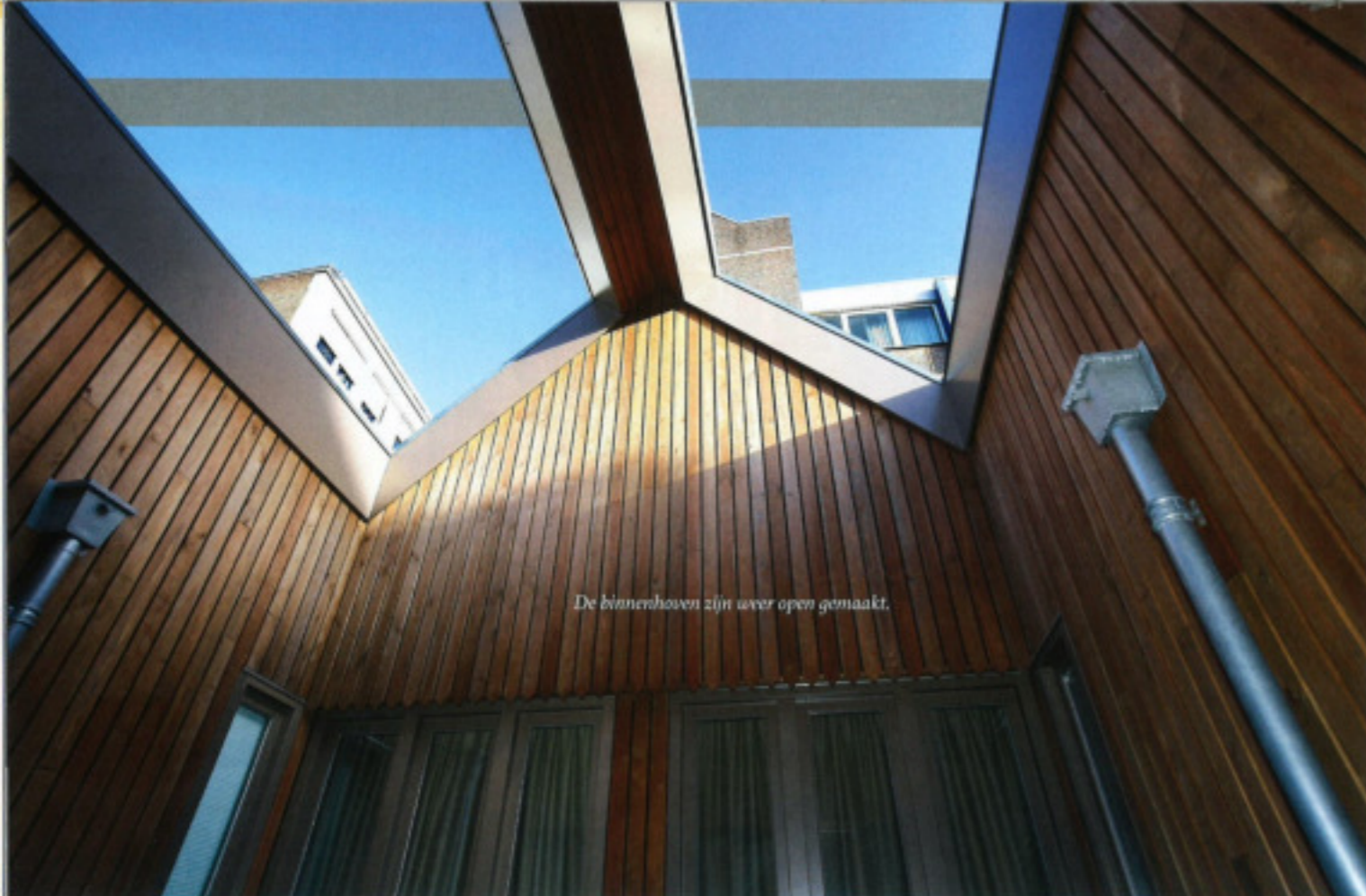
De binnenhoven zijn weer open gemaakt.

ten wi de ik massief hout het is dampen, geluid isoleren en heeft een II-ennisch gedrag overeenkomstig met het monumentale hout. Ik had eerder met Inholz gewerkt via de verkenning van de voor mij geschaalde Duits alige collegeerend tot Matthias Inholz kwam ik tot mijn verbaasde ontdekking dat hij in Duitsland op maat gemaakt waren ze in Amsterdam door ontwerpers van de Duitse firma H&S van