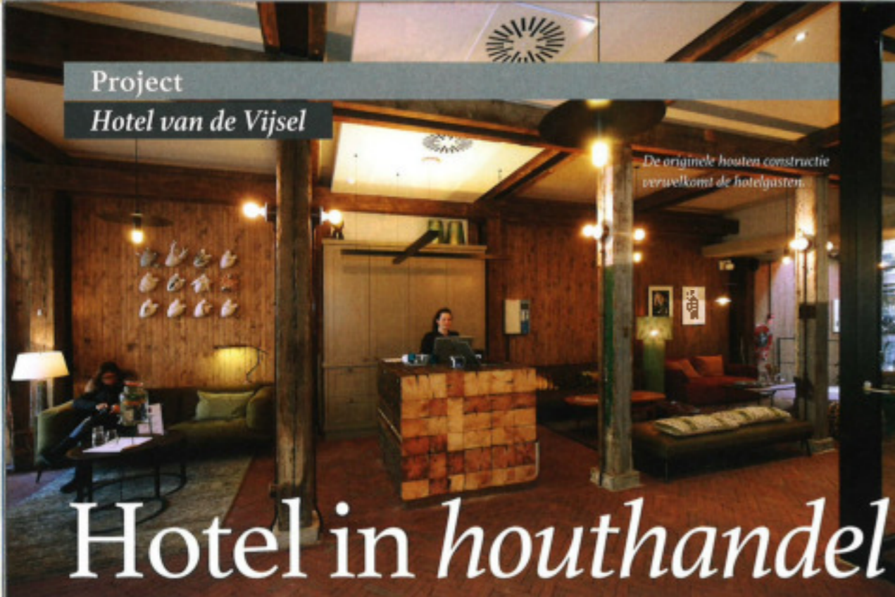
De originele houten constructie vervelkomt de hotelgasten.