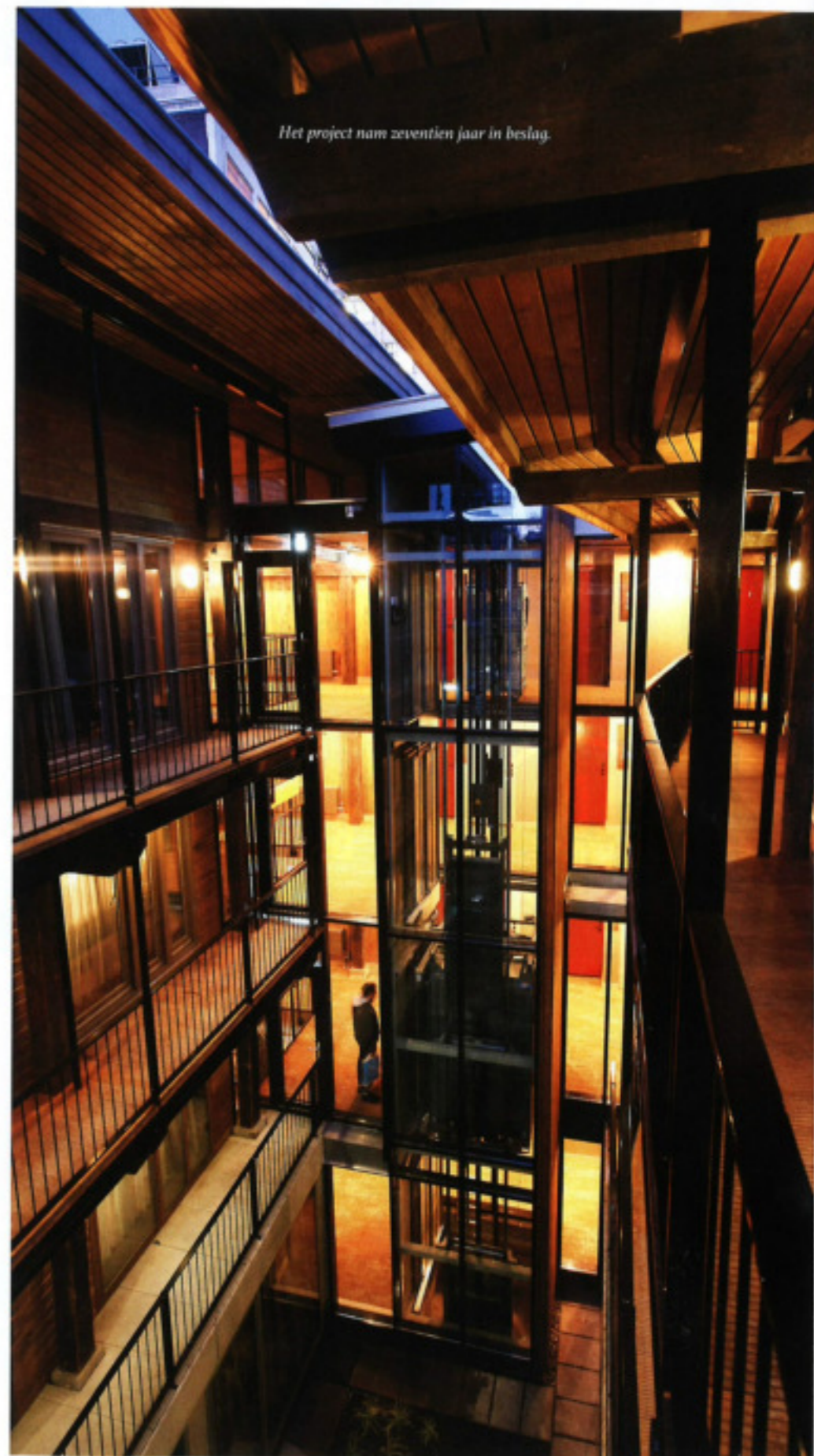
Het project nam zeventien jaar in beslag.