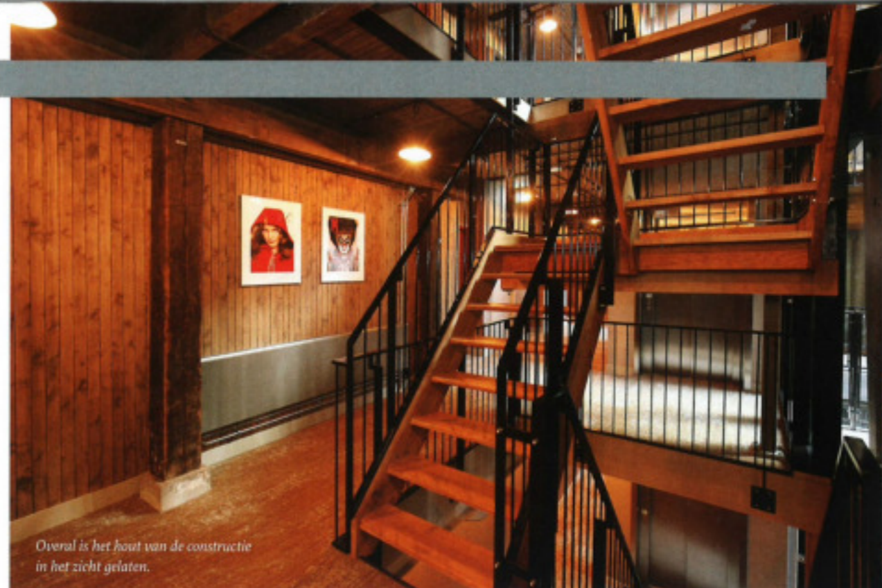
Overal is het hout van de constructie in het zicht gelaten.