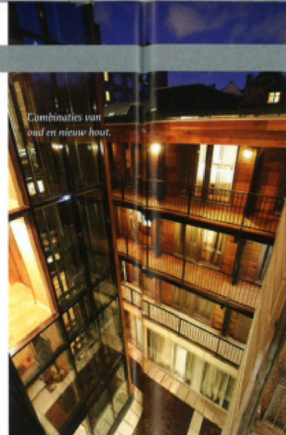
Combinaties van oud en nieuw hout.