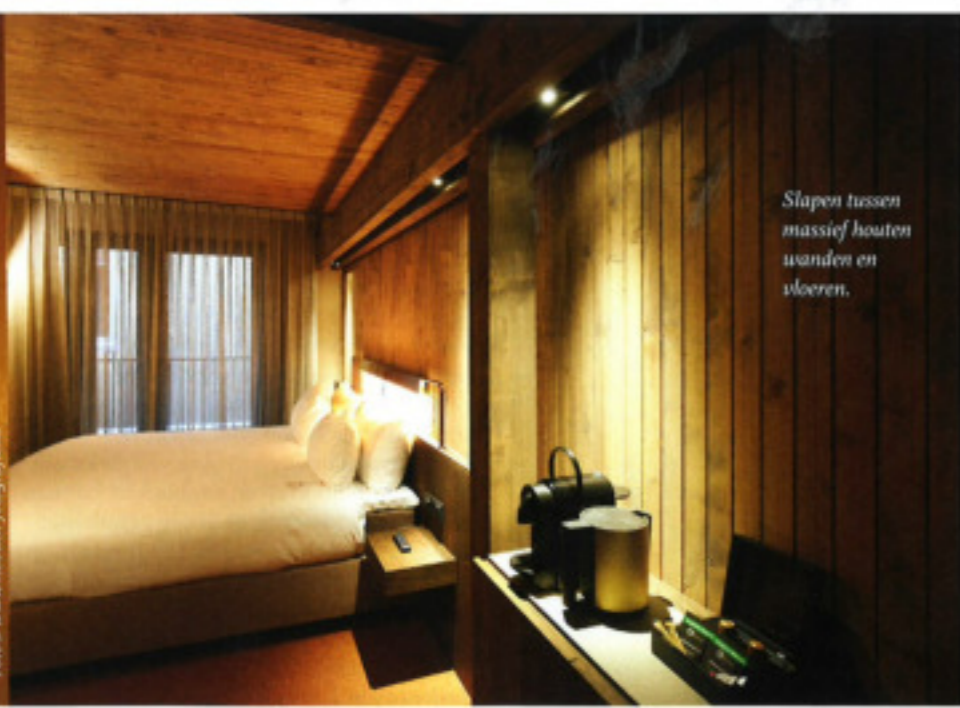
Slapen tussen massief houten wanden en vloeren.

In het ontwerp heeft de oude houten draagconstructie van de houthandel en balken draagconstructie van de houthandel. De houthandel van de houthandel houthandel in de houthandel. "Die draagconstructie bestaat uit massief houten wanden en vloeren. De houthandel houthandel de nieuwe begane grond, zijn wanden geplaatst van houten stijl die aan elkaar zijn gevestigd. Daarop zijn gedevelde massief houten vloeren geplaatst en op kwamen weer nieuwe wanden en plafonds." In het hotel Mannheim (D) fabriek van de houthandel houthandel. Het bouwproces van de houthandel is uniek en bestaat uit vier delen die met lange deuren aan elkaar zijn verbonden. Het massieve plan. Het komt geen lijn aan de post. Minka Wagenaar: "Om bouwtechnische red-